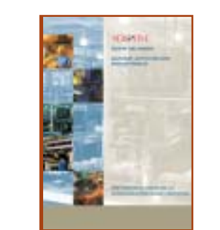
GAMME AFFICHEURS INDUSTRIELS ET INTERFACES