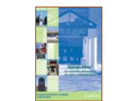
GAMME ALPHAECLIPSE : Afficheurs extérieurs