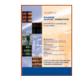
GAMME ALPHA DIRECTOR : Afficheurs à matrice de caractères

AUTRES BROCHURES EN FRANCAIS : et fiches produits en anglais disponibles pour chaque modèle