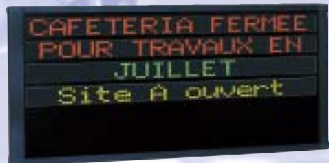
Gamme Alpha Director 4 lignes / 16 caractères