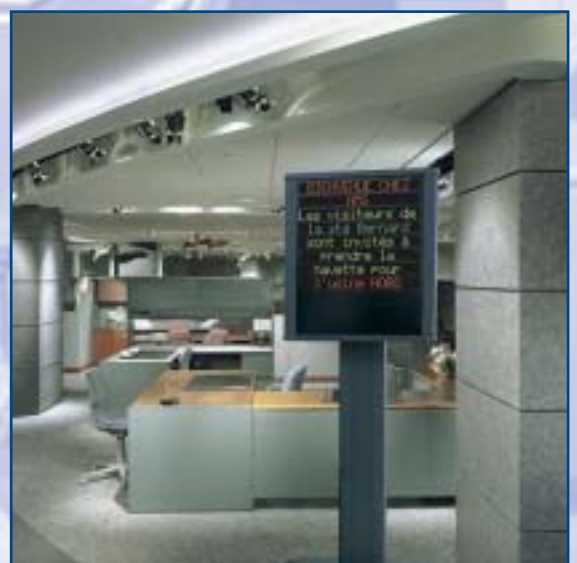
Gamme Alpha Director sur pied 8 lignes / 16 caractères