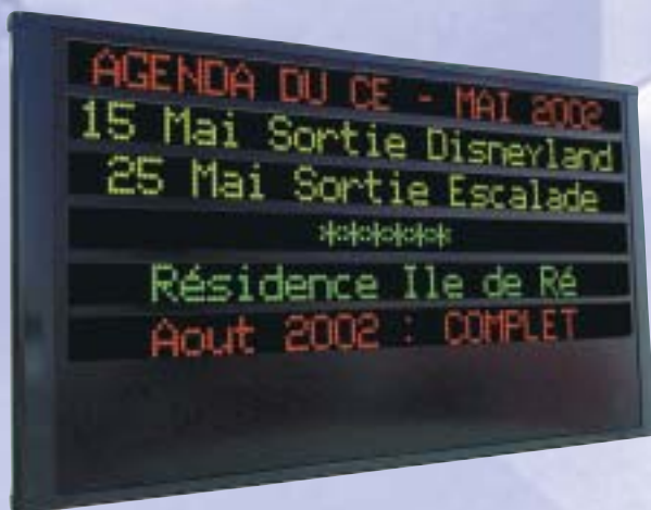
Gamme Alpha Director 6 lignes / 24 caractères