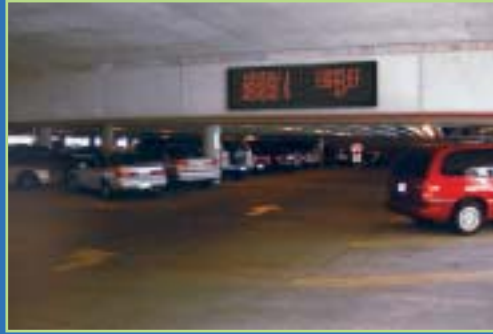
PARKINGS CONCESSIONS AUTOMOBILES