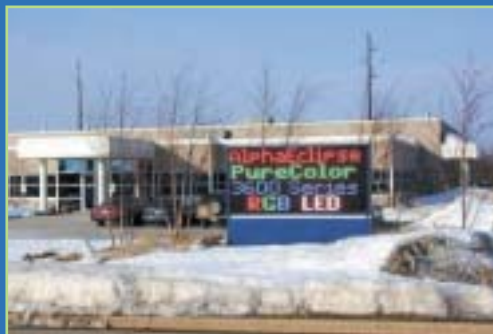
STADES UNIVERSITÉS / ECOLES