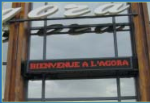
COLLECTIVITÉS SALLES DE SPECTACLES