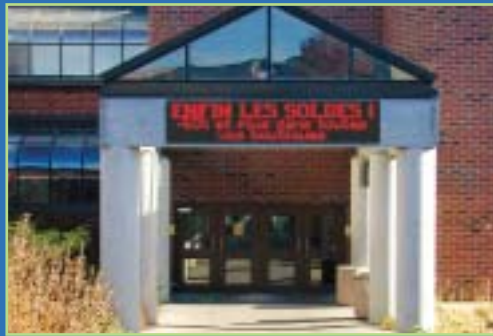
CENTRES COMMERCIAUX BANQUES